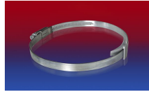
CLAMP 210 BRIDGE CLAMP